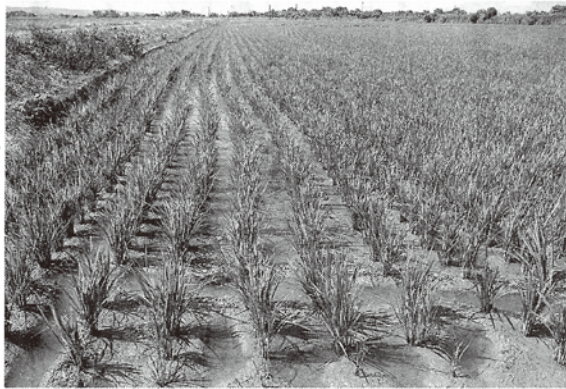
山田錦の収穫は10月中旬以降(6月23日撮影)

会員生産者が栽培し、同社で取り扱う27年産米は実に16品種。県内の蔵元向けには、主食用として越淡麗約10万石をはじめ、50万石、たかね錦も栽培する。同社の好適米搗精ラインで加工し出荷している。